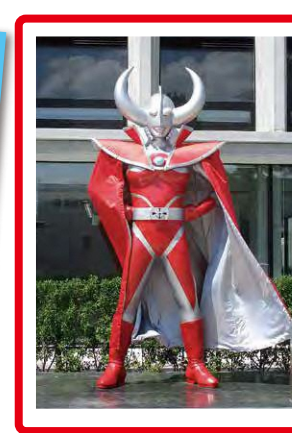
超人力霸王之父 在市政大廳迎接您

除了能在市政大廳見到超人力霸王之父，在須賀川的街道、車站等各種地方都可以見到超人力霸王的英雄們。去探尋只在須賀川才可能發生的邂逅吧！