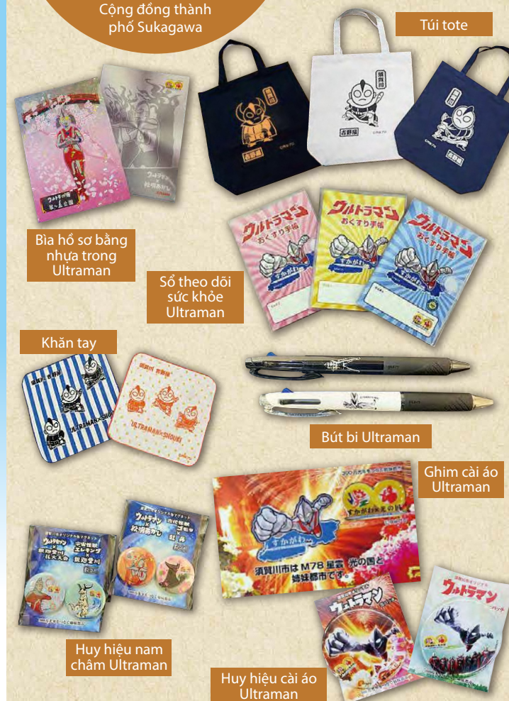
Khăn tay nhuộm thủ công

Sản phẩm Ultraman sẽ xuất hiện lần lượt. Vui lòng liên hệ Hội trường Cộng đồng thành phố Sukagawa