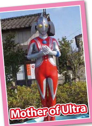
Mother of Ultra